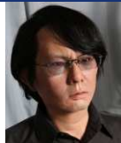
石黒 浩 大阪大学 大学院基礎工学研究科 システム創成専攻 教授（特別教授） ATR石黒浩特別研究室 室長（ATRフェロー）