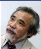
竹内 郁雄 東京大学名誉教授 早稲田大学 国際オープン教育 リソース研究所 招聘研究員